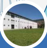
PARQUE CULTURAL DE VALPARAÍSO