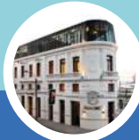
CENTRO DE EXTENSIÓN DUOC UC SEDE VALPARAÍSO