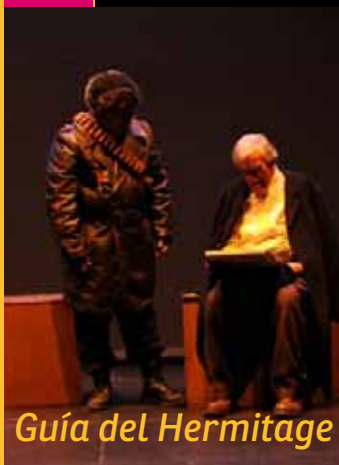
Guía del Hermitage