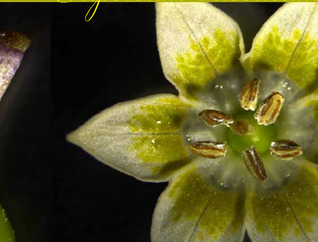
De izquierda a derecha: estambre, pistilo, flor completa.

Fotos tomadas en Lupa estereoscópica Leica MZ10F con Cámara digital Leica DFC450C. Espacio Huerto PCdV [Parque Cultural de Valparaíso] colabora Instituto de Química [PUCV]