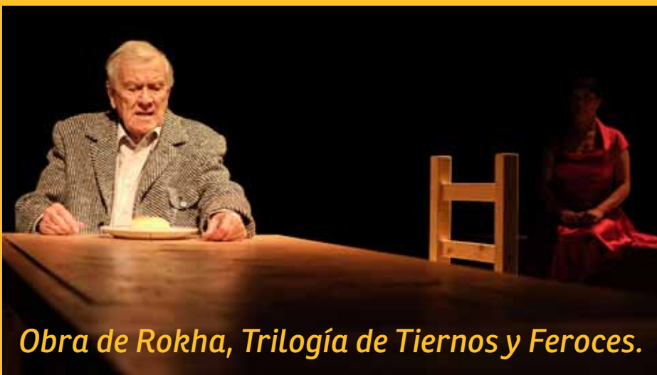
Obra de Rokha, Trilogía de Tiernos y Feroces.