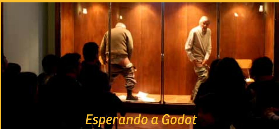
Esperando a Godot